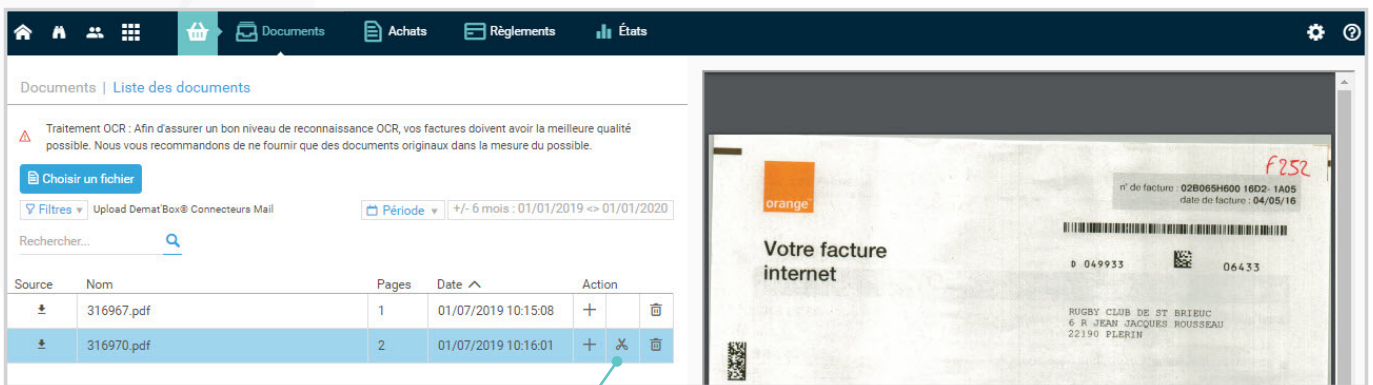
Découper le fichier Pdf en plusieurs pages.

Si le PDF contient 2 pages, le découpage va les séparer en 2 fichiers uniques. Vous pouvez choisir de garder le fichier d'origine en cochant la case correspondante.